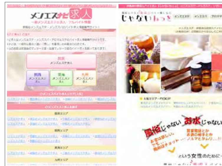
メンエステナビ求人 トップページ

【メンエステナビ求人】【じゃないねっと】は非風俗店のみ（メンズエステ、マッサージ、リフレ系）を掲載している女性向け高収入求人・副業バイト専門サイトです。首都圏・関西エリアを中心に、女性向けの求人情報を紹介しております。