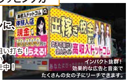
インパクト抜群! 効果的な広告と音楽で たくさん女の子にリーチできます。

女の子が集まる場所や時間を狙い打ち! 動く宣伝トラックに覚えやすい オリジナル楽曲で繁華街を爆走中!