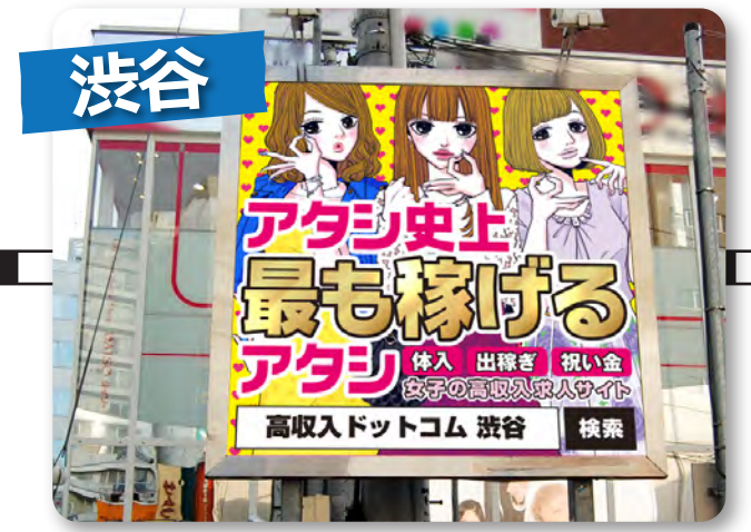
ギャルの聖地“センター街”で待ち構えています!