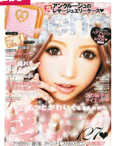
小悪魔ageha(インフォレスト) 発行部数36万部、20台前半のギャル系女子のための ビューティー雑誌