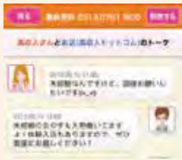
スマートフォンでのタイムライン表示