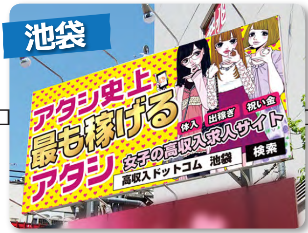
北口の歓楽街“西一番街入口”で注目浴びまくり!