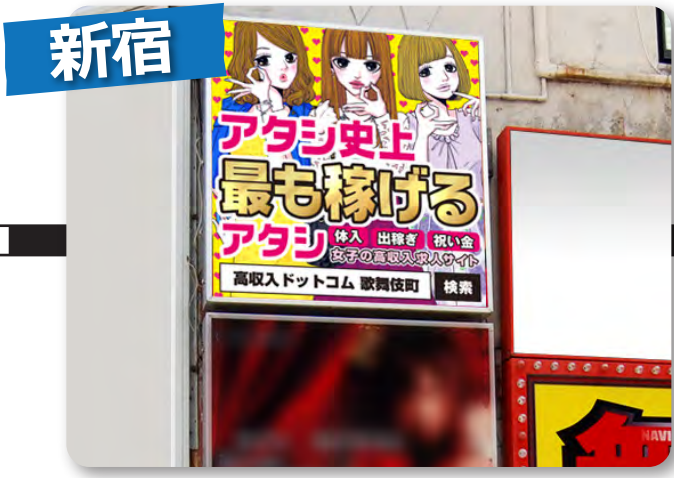
眠らない街“歌舞伎町”で24時間超絶アピール★