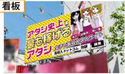
屋外看板について詳しくはP9へ!