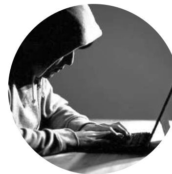
ネットの 誹謗中傷

これらの多様な課題に対し、アークレストでは確かな手段と専門知識で アプローチを実施。安定したビジネス運営をサポートします！