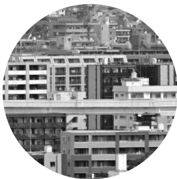
マンション トラブル